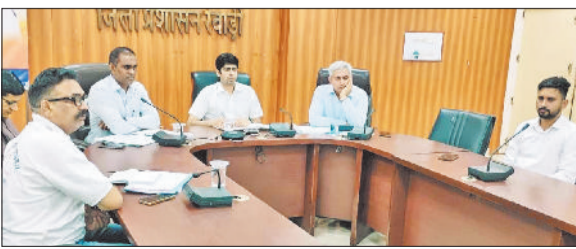
रेवाड़ी। अधिकारियों को आवश्यक दिशा निर्देश देते हुए डीसी अभिषेक मीणा।

जनगणना 2027 के अंतर्गत हरियाणा में मकान सूचीकरण एवं मकानों की गणना संबंधी महत्वपूर्ण कार्य 1 मई से 30 मई की अवधि तक अनिवार्य रूप से किया जाना है। जिले के प्रधान जनगणना अधिकारी एवं डीसी अभिषेक मीणा ने वीरवार को लघु सचिवालय सभागार में 1 मई से शुरू होने वाले मकान सूचीकरण एवं