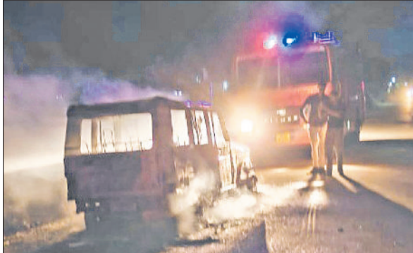
रेवाड़ी। जैसलमेर नेशनल हाइवे पर जली बोलेरो गाड़ी।