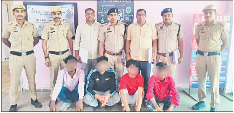
रेवाड़ी। पुलिस गिरफ्तार में ठगी के चार आरोपी।