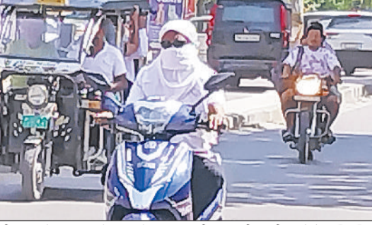
रेवाड़ी। वीरवार को धूप व लू से बचाव के साथ स्कूटी पर जाती युवती।

कुछ स्थानों पर मामूली बूंदबांदी भी हुई। इसके बाद आसमान साफ हो गया। दोपहर तक भारी गर्मी का असर शुरू हो गया, जिससे सड़कों से लेकर बाजार तक से भीड़ गायब हो गई। अधिकतम तापमान 2.5 डिग्री सेल्सियस बढ़कर 40.5 डिग्री पर आ गया। न्यूनतम तापमान 5.8 डिग्री बड़ी वृद्धि के साथ 25.5 डिग्री सेल्सियस पर पहुंच गया। रात के समय गर्मी ने फिर से लोगों को परेशान करना शुरू कर दिया है। हाक में नमी का स्तर 25 प्रतिशत तक रहा, जबकि दिन में 20 किलोमीटर प्रति घंटा की रफ्तार से