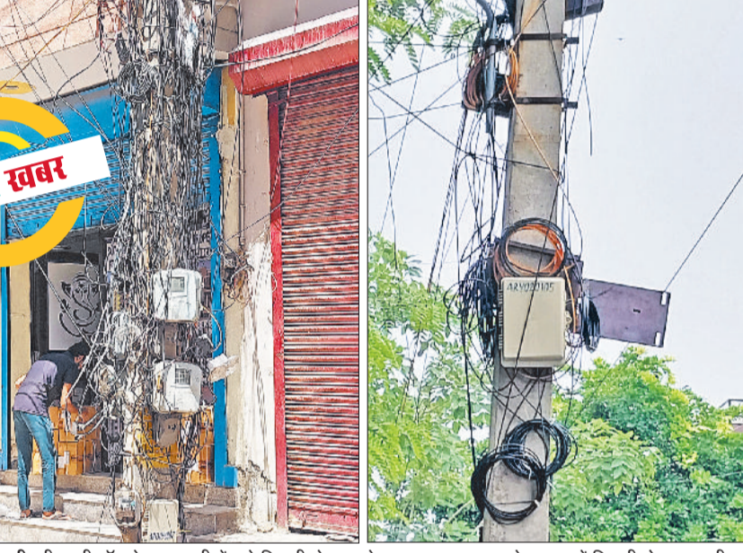
रेवाड़ी। बीएमजी मॉल के पास गली में लगे बिजली पोल पर केबल का मकड़जाल, सेक्टर-1 में बिजली पोल पर लगी डिश केबल व बॉक्स।