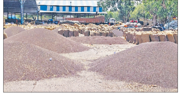
रेवाड़ी। अनाजमंडी में लगी सरसों की ढेरियां।