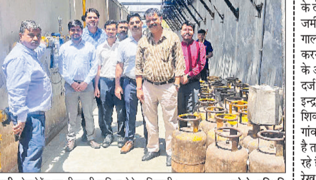
रेवाड़ी। रेस्टोरेंट पर पीएनजी सुविधा देते अधिकारी।