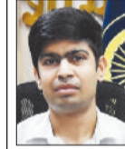
डीसी ने बताया कि अभियान के तहत लगभग 75 वर्ष या उससे अधिक पुरानी पांडुलिपियों को प्राथमिकता दी जाएगी। सरकार की ओर से सर्वेक्षण को तीन माह के भीतर पूर्ण करने का लक्ष्य निर्धारित किया गया है। अभियान 15 जून तक जारी रहेगा। इसके बाद डिजिटलीकरण और संरक्षण कार्य आगे बढ़ाया जाएगा। उन्होंने कहा कि इस पहल से जिले की ऐतिहासिक धरोहर को सुरक्षित रखने के साथ-साथ सांस्कृतिक विरासत के संरक्षण को भी मजबूती मिलेगी।

बल्कि इससे आने वाली पीढ़ियों को प्राचीन ज्ञान से जोड़ने का भी कार्य किया जा रहा है। उन्होंने सभी बीडीपीओ को निर्देशित करते हुए कहा कि वे ग्राम सचिवों के माध्यम से गांव-गांव में स्थित मंदिरों, गुरुद्वारों, मस्जिदों तथा अन्य धार्मिक एवं सामाजिक संस्थानों में उपलब्ध हस्तलिखित पांडुलिपियों की जानकारी एकत्रित करें। यदि किसी